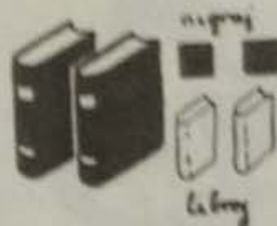
Nigraj — libroj.

Kie estas la steloj? (Sur la ĉielo.) Kie estas la verda stelo? (Sur la esperantisto.) Ĉu vi estas perfekta esperantisto? Kiu estas perfekta esperantisto? Ĉu la libro estas verda? Ĉu la muro estas verda? Kio estas verda? Kio estas blua? Kio estas bruna? Kio estas nigra? Kio estas blanka? Kio estas griza? Kio estas ruĝa? Ĉu la ĉielo estas nigra? Ĉu la blua ĉielo estas granda?