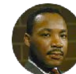
MARTIN L. KING