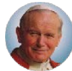
GIOVANNI PAOLO II