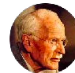
CARL G. JUNG