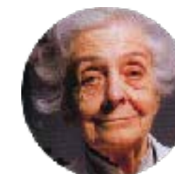
R. LEVI MONTALCINI